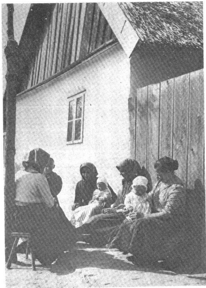
189. Kapu előtti beszélgetők karonülökkel, 1930-as évek vége

3. A különböző vagyoni helyzetű rétegek — főleg nők — öltözetében nem mutatkozik nagy különbség. Sőt, a Szegedre napszámba járó szegényparaszt lányok jobban öltözködnek,