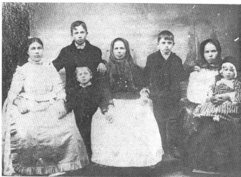
186. A Sövényházi és Török család az első világháború idején