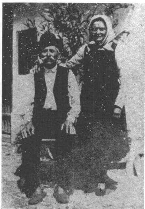
193. Házaspár munkaruhában, 1930-as évek