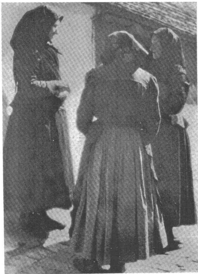
188. Idős asszonyok, 1930-as évek vége

1. A ma élő 75—85 évesek fiatalkorában, tehát a század elejétől, a régebben egyszerű, sötét színű ruhadarabokon megjelennek a szabás, a díszítés változatai, és a színes anyagok. A régebben is elterjedt fehér vásznak mellett kedvelté válnak a rózsás mintás kartonok, batisztok, zefírek stb.