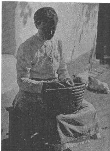
191. Asszony szatyorkában , fityulával és kötő ben, 1930-as évek vége