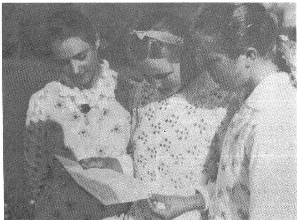
192. Nagylányok, 1930-as évek vége