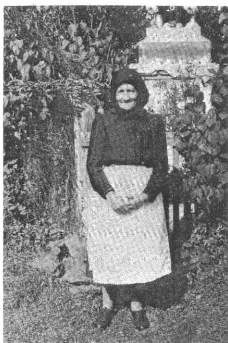
194. Idős asszony tápai búcsúkor, 1969.