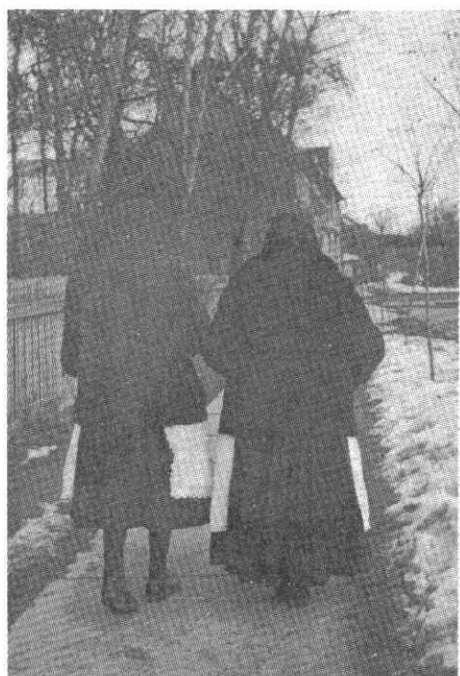
195—196. Idős asszonyok téli ünneplője, 1969.