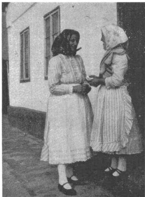
190. Fiatalasszonyok, 1930-as évek vége